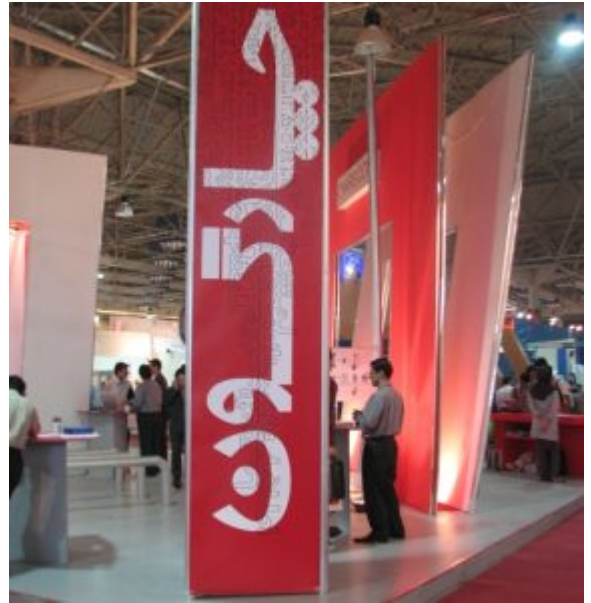
شرکت چارگون در نمایشگاه کامپ 83