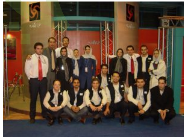
شرکت چارگون در نمایشگاه الکامپ 82

چارگون در سال‌های 82، 83 و 85 حضوری فعال در الکامپ داشت. اما مشکلات متعدد در برگزاری این نمایشگاه که هیچوقت مورد توجه برگزارکنندگان نمایشگاه قرار نگرفت، باعث شد که چارگون حضور در این نمایشگاه را از دستورکار سالانه خود خارج نماید.